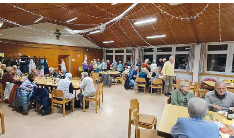
Nach dem Gottesdienst frohe Begegnung im Pfarrheim St. Franziskus

Beim Weltgebetstag des internationalen Kolpingwerkes 2025 stand das südasiatische Land Myanmar im Blickpunkt und das dortige Kolpingwerk in der Verantwortung für die Vorbereitung dieses Tages der weltweiten geistlichen Verbundenheit im Kolpingwerk am 27. Oktober, dem Tag der Seligsprechung Adolph Kolpings. Dieser Tag wird im Bezirk Hannover seit 2004 mit einem festlichen Gottesdienst bei der Kolpingsfamilie St. Franziskus in Hannover-Vahrenheide begangen. Es ist zu einer guten Tradition geworden, dass in dieser Eucharistiefeier die Kolpingsfamilien des Bezirksverbandes mit ihren Bannern und möglichst vielen Mitgliedern zusammenkommen und dabei für ein Projekt des jeweils vorbereitenden Nationalverbandes die Kollekte halten und den Erlös spenden.