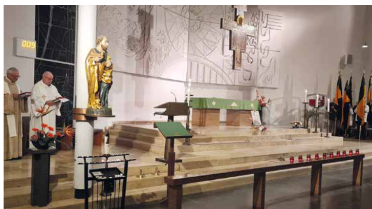
Weltgebetstag-Gottesdienst und Gedenken der 19 verstorbenen Kolpinggeschwister Hannovers