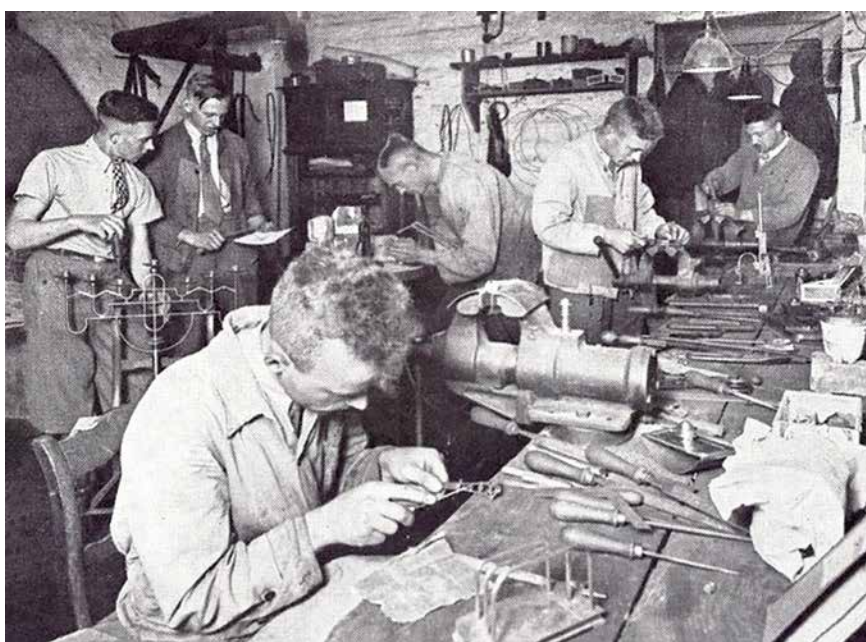
Hannoveraner Gesellen in den Fachabteilungen Anfang der 1930er

katholischen Gesellen weiter offenzuhalten und warf ihnen sogar „Bruch mit Kolpings Tradition“ vor. Er forderte von der Hildesheimer Kurie: „Wir sind vor Gott verpflichtet, jede Möglichkeit auszuschnöpfen, unseren armen, verzweifelten Jungen zu helfen und wenn wir das letzte Möbel aus dem eigenen Haushalt verkaufen müssten. Ich hätte niemals gedacht, daß ausgerechnet Hannover mir diesen Schmerz antun würde. Überlegt doch und sucht nach Mitteln. Echt christliche Liebe verzweifelt nie. Auch gilt es, den weiten Kreis der Altkolpingen, Ehren- und Schutzmitglieder in der Stützung der Wanderpflege mit herein-zuziehen. Es müsse eine Dankesschuld des katholischen Deutschlands sein, all das, was der katholische Gesellenverein seit fast einem Jahrhundert am Aufbau des Volkes geleistet hat, in dieser Zeit der Not zu vergelten