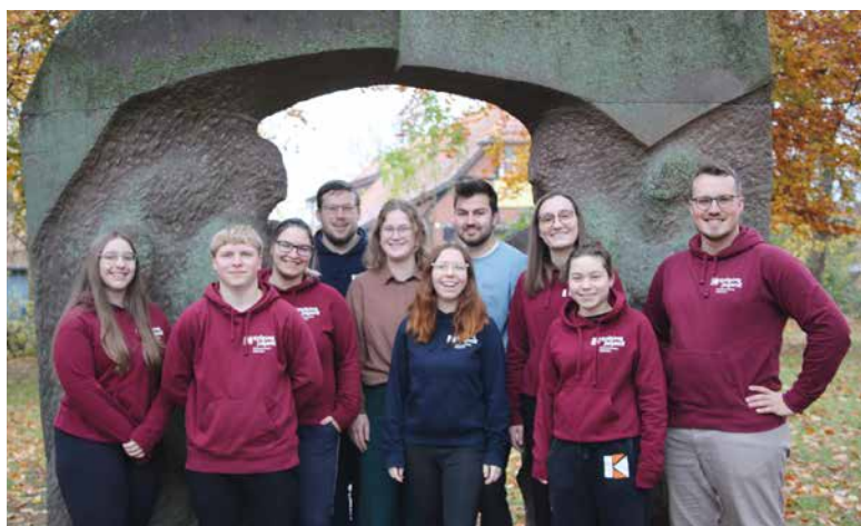
Das neue Leitungsteam der Kolpingjugend