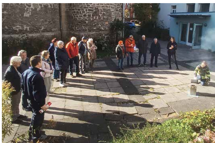
Wie löscht man einen Fettbrand – Demonstration für die Gruppe

Bitte notieren: Der Termin für das nächste Austauschtreffen Seniorenarbeit ist der 17.10.2026 .